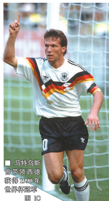
马特乌斯曾带领西德获得1990年世界杯冠军