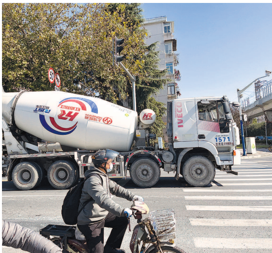
■ 华宁路上常有大型车辆经过