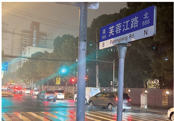
■ 芙蓉江路沿线多名居民反映马路吵闹