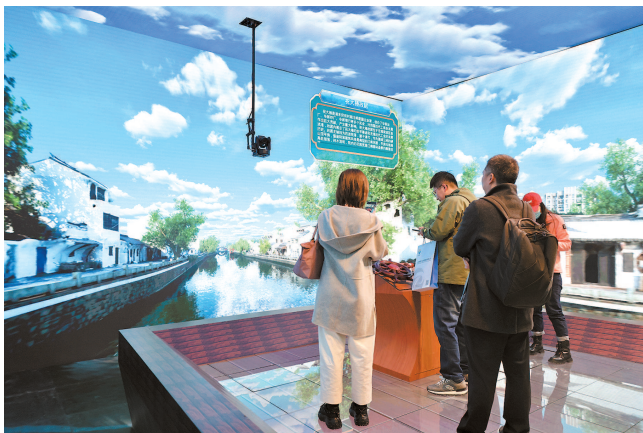
■ 江苏展区用AI数字建模技术,复刻大运河沿线文化遗产

本报讯(记者 孙佳音)第四届长三角国际文化产业博览会(以下简称“长三角文博会”)今天上午在国家会展中心(上海)开幕。