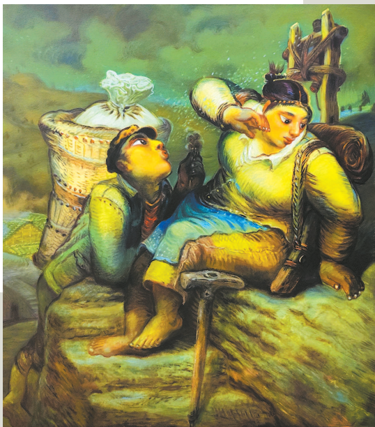
◀ 蒲公英·绿调 罗中立