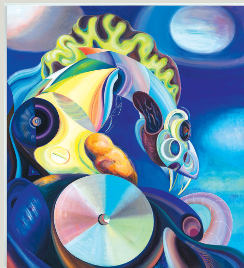
▲ 斯芬克斯(6) 简策