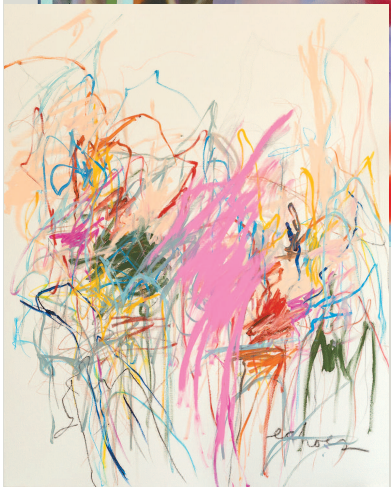
◀ 回响记忆#1 阿德里安·尼美斯