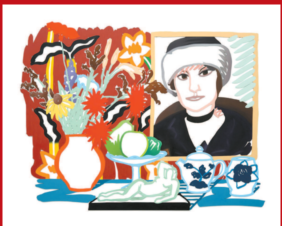
▲ 静物与两幅马蒂斯(肖像) 汤姆·威瑟尔曼

应青蓝记得十一年每一届的艰辛,也感恩着十一年的积累和获得。ARTO21是一个大平台,可以包容各种形式的艺术,“我们希望它是国际化的,但是我们更注重本土的培养,希望踏踏实实把博览会一步一步做好,成为一张城市的文化名片”。