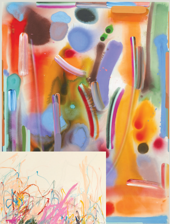
▲ 红与黄的交织 艾玛·斯通-约翰森