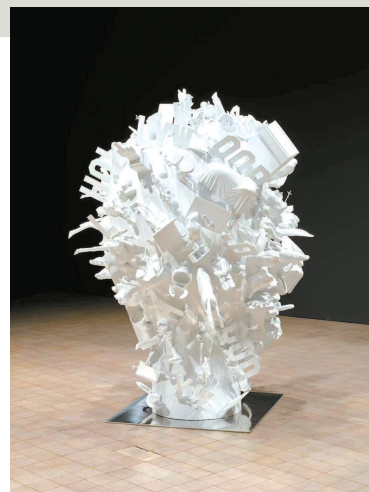
▲ 虚空 莫瑞吉奥·卡特兰

要组成部分,优秀的城市公共艺术亦成为打造城市新名片的切入点。为了体现共建社会大美育的艺术职责,在四大核心板块中,特设BEYOND公共单元,以打破传统博览会展位的边界,提升公众参与艺术的热情。除此之外,13场立足于“共享&参与”的论坛在现场与线上同步放送,探讨内容涉及艺术时尚、艺术科技、艺术商业与现当代艺术等炙手可热的话题,以专业经验和社群力量为推动艺术行业发展提供可执行的策略和参考方案,推动社会大美育的传播。