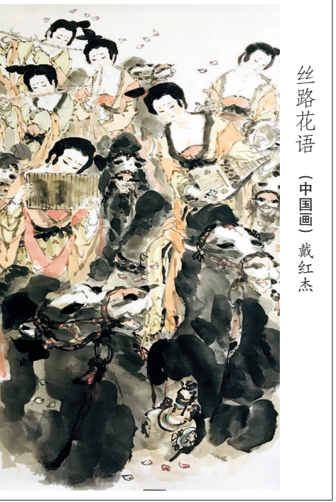
丝路花语 (中国画) 戴红杰

时编导偏不让贾宝玉来唱，只让他愣在那儿，然后合唱声起：“好一条偷襟换柱的调包计，只赢得惨红烛映照洞房。”对贾母与王熙凤预先设下的诡计，进行了无情而尖锐的讽刺。