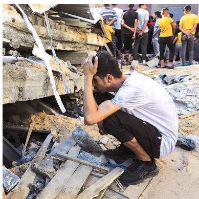
加沙一名男子蹲守在废墟旁

文件认为,要赶走加沙民众,最大障碍来自埃及等阿拉伯国家以及国际压力。因此,美国的支持至关重要。