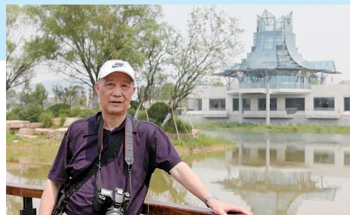
最爱研究不同风格的建筑