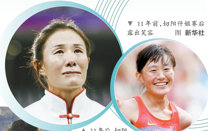
▲ 11年后,切阳什姐热泪盈眶

奥运冠军、三届世锦赛冠军、两次亚运会冠军……在切阳什姐心目中,“虹姐始终都是我的榜样”。本届亚运会,因为伤病,刘虹并没有参赛。接受本报记者独家专访时,她悄悄透露:“上午的金牌,我提前就预测到了。切阳值得。”