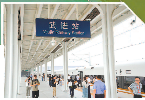
铁路武进站今天启用

沪宁沿江高铁今天正式开通运营。9时24分，首发列车G7799次缓缓驶出武进站；10时57分，列车抵达终点站上海虹桥站。至此，历时近五年建设的沪宁沿江高铁作为上海至南京间第二条城际铁路投用，长三角铁路路网进一步织密，区域一体化发展取得新成效。这个假期，沪宁沿江高铁沿线群众“乘坐高铁去旅行”将变成实实在在的生活。（相关报道见第3版）