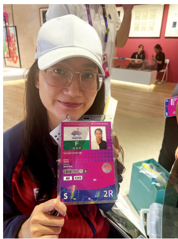
■ 越南国际象棋选手蒂金蓬沃