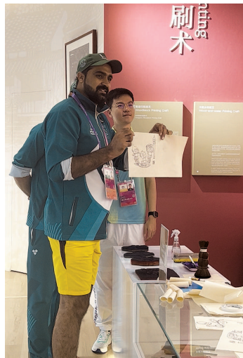
■ 外国选手体验中国印刷术