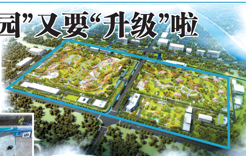
■ 泰和污水处理厂效果图,蓝框内为污水处理设施所在区域

本报讯(记者 裘颖琼)作为上海首座“花园式”全地下污水处理厂,泰和污水处理厂已投入使用的一期项目规模为40万立方米/日。目前,二期扩建工程已进入快速推进期。