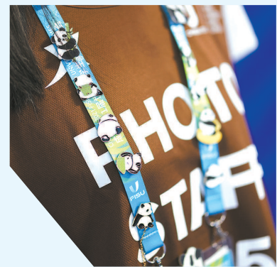
志愿者佩戴的徽章