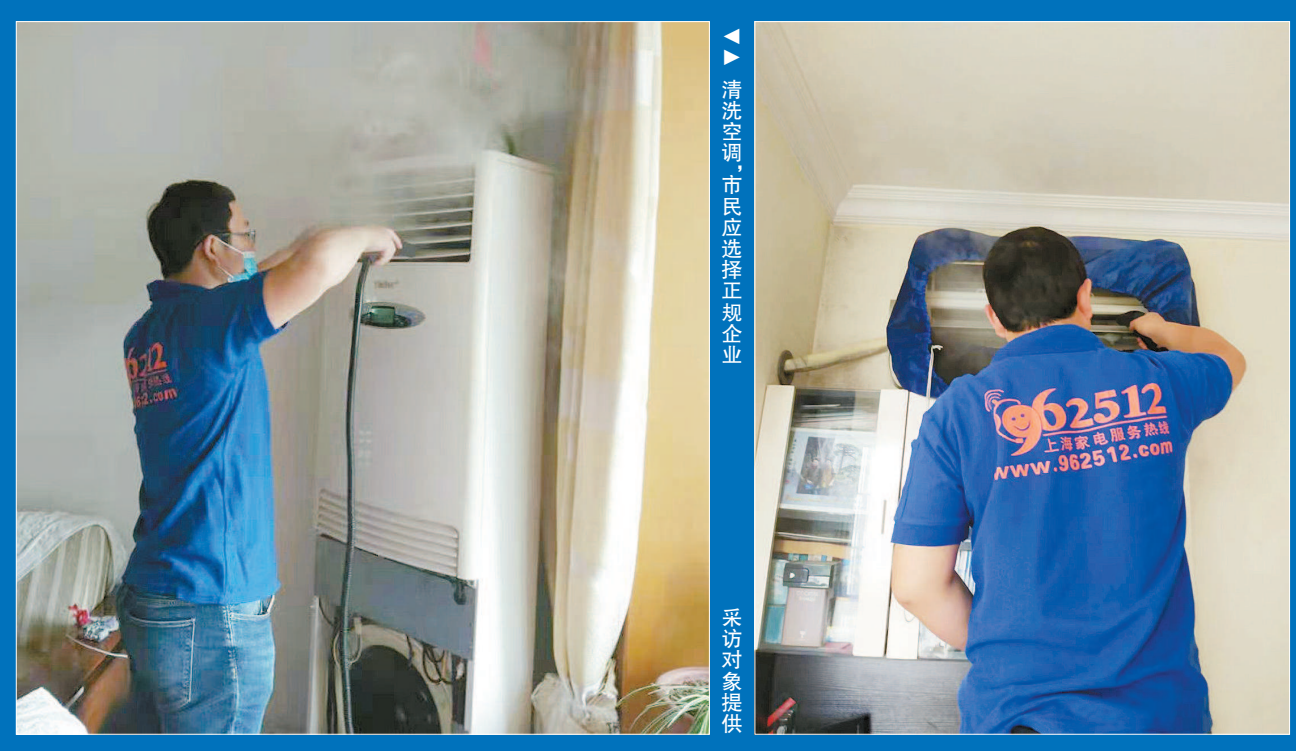
清洗空调,市民应选择正规企业