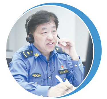
徐志虎在接受市民来电

营造法治化营商环境,深化智慧化城市管理。今天上午,上海市城市管理行政执法局党组书记、局长徐志虎走进新民晚报夏令热线,接听市民来电并接受专访。徐志虎表示,今年城管执法部门聚焦优化营商环境、餐饮油烟扰民、小区综合治理等市民反映突出的问题,出台一系列新举措,开展专项整治,增强市民的幸福感和获得感、满意度。