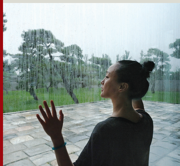
▲ 歌手、演员周迅(2021年于北京)