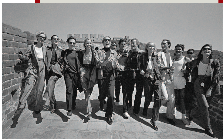
▲ 美国时装设计师罗伊·休斯顿和模特游览长城(1980年)