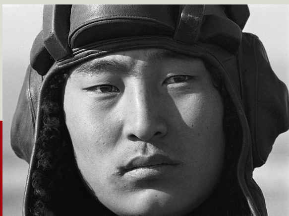
▲ 中国陆军装甲部队战士(1980年于北京)