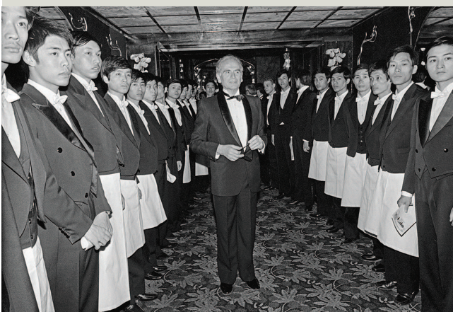
▲ 法国服装设计师皮尔·卡丹在北京参加他的马克西姆餐厅第一家国际分店的开业仪式(1983年)