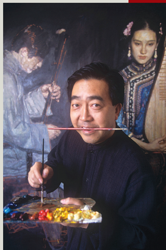
▲ 艺术家陈逸飞在工作室作画(一九九六年于上海)