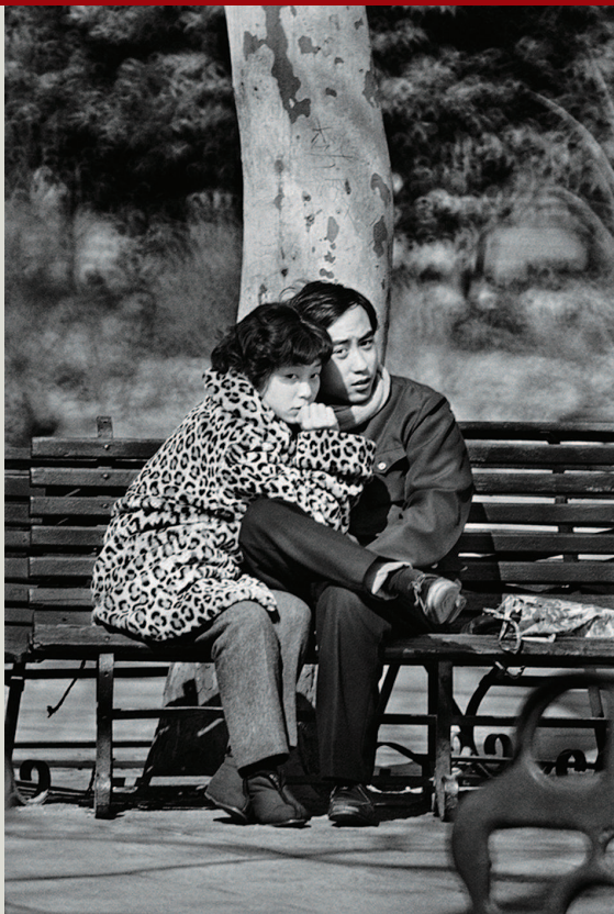
▲ 上海人民公园长椅上的青年情侣(1978年)

近期,“刘香成 镜头·时代·人”大型摄影展在浦东美术馆举行。20世纪70年代末,刘香成是首批端着照相机记录中国的记者之一,留下了许多珍贵的视觉记忆。作为一位获得过多个奖项的摄影家,他的摄影方法论不仅奠定了关于中国报道的影像风格,也对新闻摄影的趣味和方法产生了深远影响。以下为复旦大学新闻学院教授、摄影评论家顾铮的评述。 ——编者