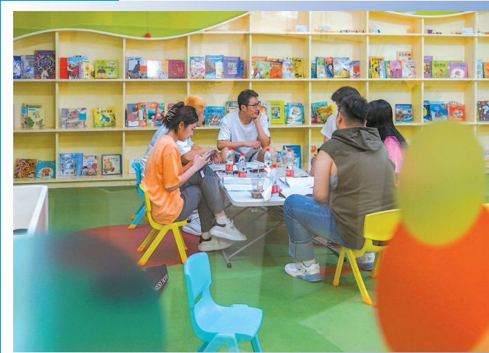
徐家汇街道社区党群服务中心长者运动健康之家 古北市民中心还设有青少年在活动区域