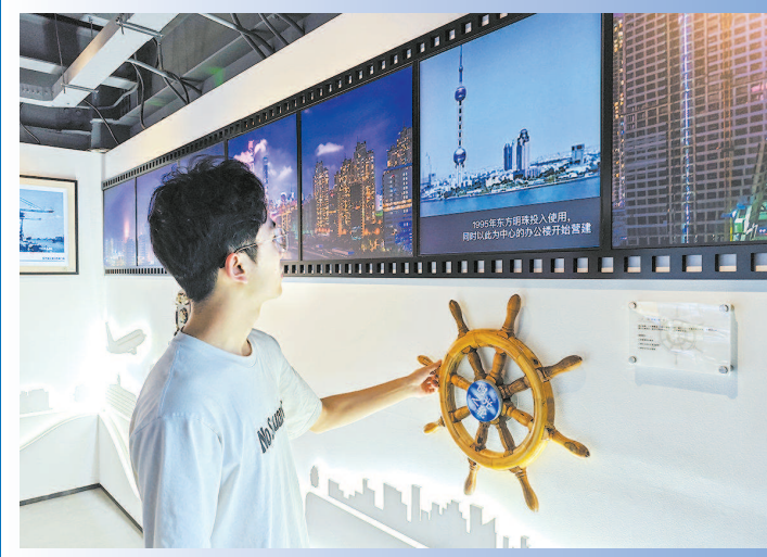
徐家汇街道社区食堂吸引附近的居民就餐 徐汇滨江党群服务中心展示“一江一河”的发展沿革