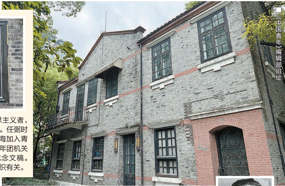
《中国青年》编辑部旧址

任弼时,湖南汨罗人,伟大的马克思主义者,杰出的无产阶级革命家、政治家、组织家。任弼时走上革命道路的起点,始于1920年在上海加入青年团。他辞世前的最后一篇文章是为青年团机关刊物《中国青年》创刊27周年撰写的纪念文稿。任弼时在上海的足迹几乎都与共青团组织有关。