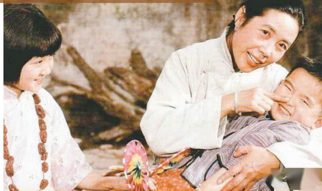
电影《城南旧事》剧照