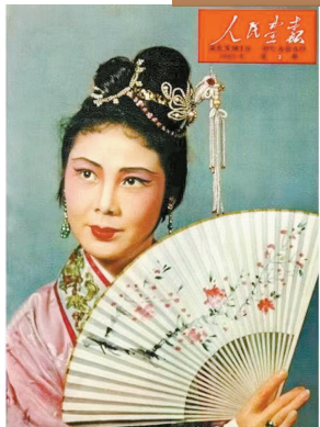
君,刊载于一九六二年《人民画报》封面