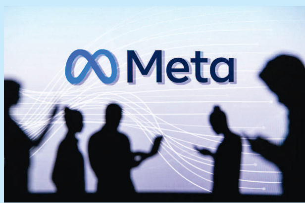
▲ Meta陷入隐私泄露风波