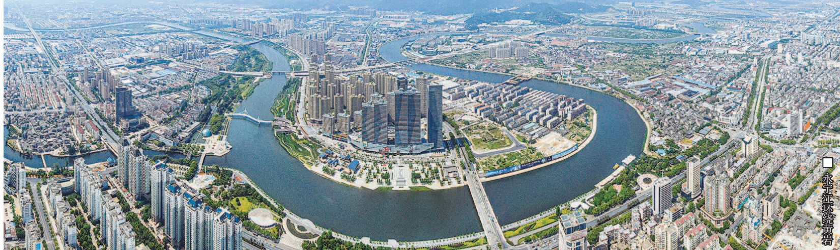
永宁江科创带黄岩