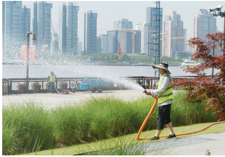
今天上午,杨浦滨江绿之丘,园林工人顶着骄阳为绿植洒水

据上海中心气象台预报,晴热晒的主打歌即将告一段落,明日白天,本市仍以多云天气为主,最高气温预计为30℃。但是,明天夜间,随着冷空气渗透南下,冷暖气团交汇,本市将转为阴到多云有时有阵雨或雷雨的天气,尤其是17日雨势明显增强,并可能伴有雷电活动。冷空气的到来,也让气温坐上“过山车”,17日的最高气温将跌至23℃左右,19日天气才会重新转好,气温回升。天气多变也让人夏倒计时多了几分悬念,17日和18日的气温是否达标,成为此轮入夏冲刺的关键。