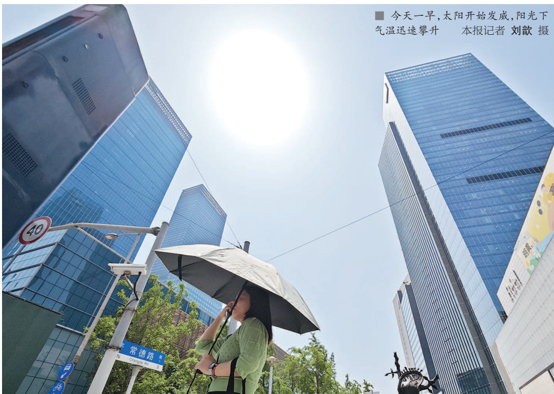
今天一早,太阳开始发威,阳光下气温迅速攀升