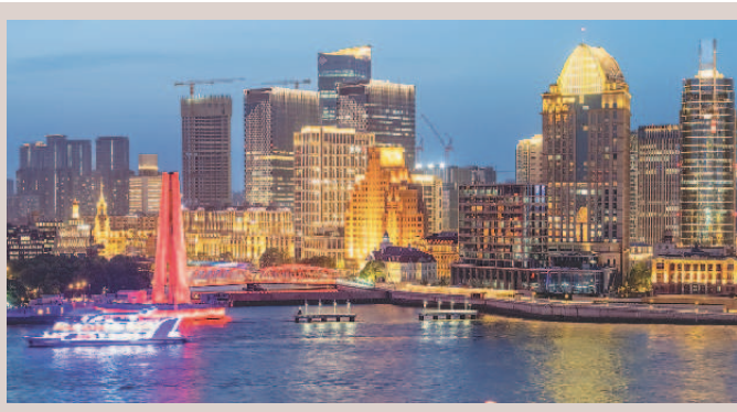
▲ 苏州河与黄浦江交汇处