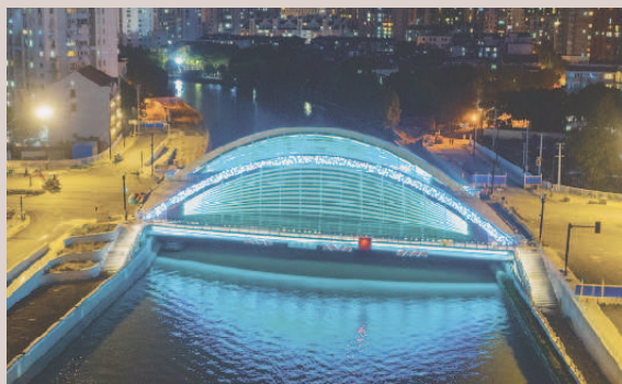
■ 夜晚的昌平路桥