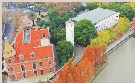
■ 蝴蝶湾花园 周馨 摄