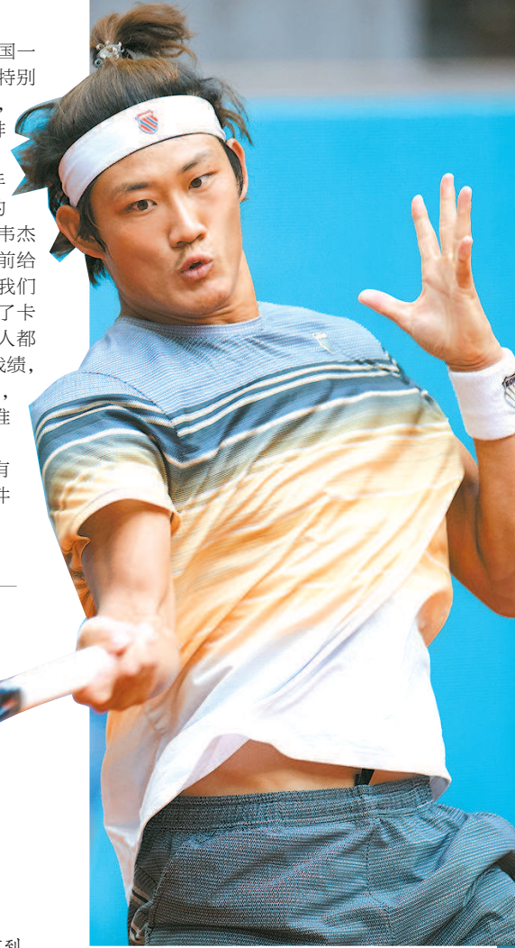
张之臻2比1战胜美国选手弗里茨晋级八强