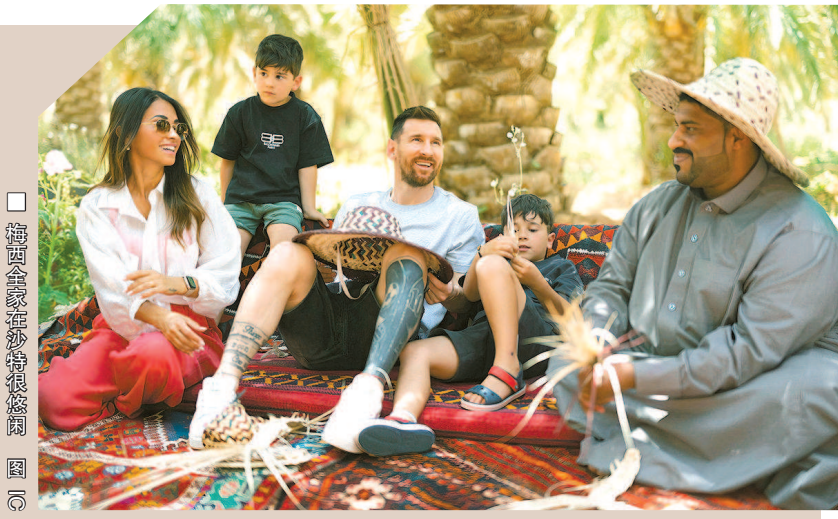
梅西全家在沙特度假

自己当成“摇钱树”;大巴黎认为梅西心猿意马,在场上未尽全力,导致球队输球。如此局面下,大巴黎痛下杀手,等于和梅西提前告别。