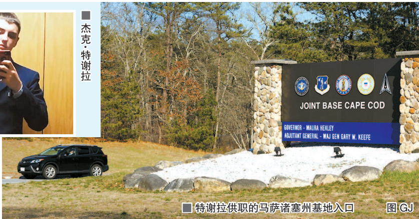
特谢拉供职的马萨诸塞州基地入口

据《华盛顿邮报》报道,“OG”被网友视为“有魅力的枪支爱好者”。聊天群组成员来自全球多地,有着对枪支和武器装备的共同爱好,新人仅能通过成员邀请加入。