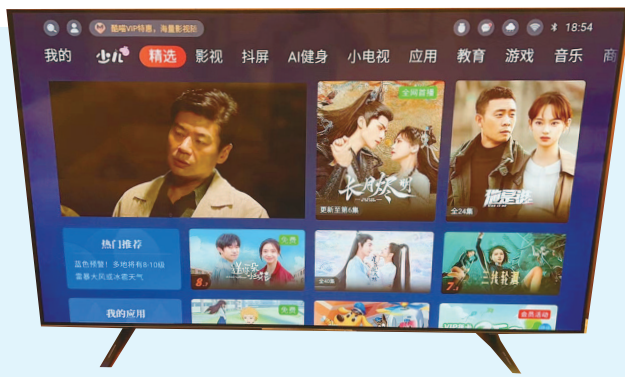
▲ 如今的平面屏电视