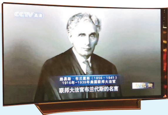
▲ 此前购买的曲面屏电视