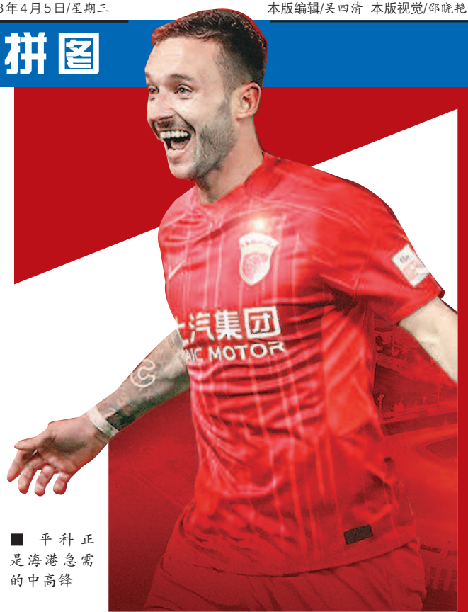
■ 平科正是海港急需的中锋