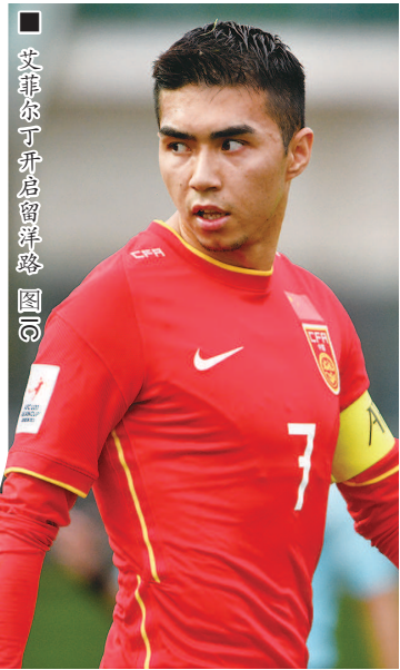
■ 艾菲尔丁开启留洋路 图②