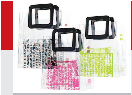
▲ “精品馆藏”系列中的《长短经》透明手袋