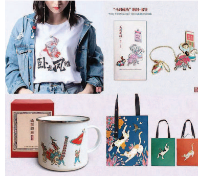
▲ “小校场年画”系列中的部分文创作品