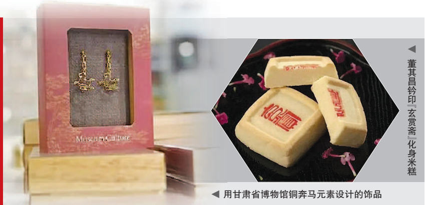
▲ 用甘肃省博物馆铜奔马元素设计的饰品