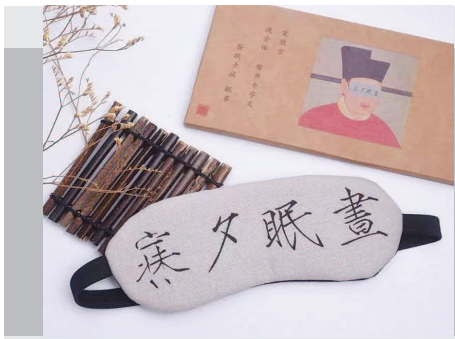
▲ 以宋徽宗瘦金体“昼眠夕寐”设计的眼罩