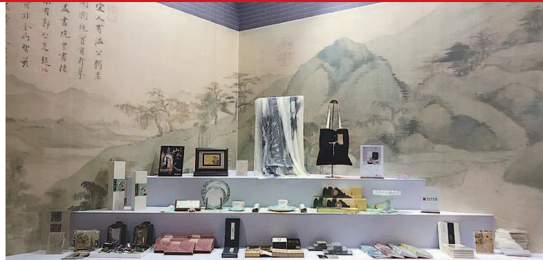
上海博物馆的董其昌系列文创产品

这是一个文创设计遍地开花的时代，一部当红电视剧可以衍生出众多周边，一场热演话剧也能带火IP授权设计。申城的文化人因此找到了传统审美文化与现代生活方式的融合之道，不仅让“沉睡”的馆藏瑰宝释放出巨大能量，更是开启了国际设计之都的文创设计新境界。——编者