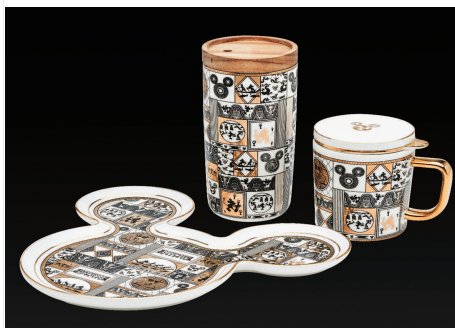
▲ 大克鼎与米奇牵手的“博物奇趣”系列杯具