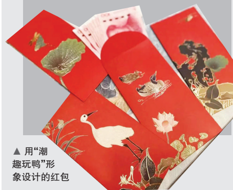
▲ 用“潮趣玩鸭”形象设计的红包