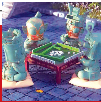
▲ 以三星堆面具演绎设计的打麻将手办