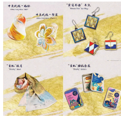
▲ “徐家汇藏书楼”系列中的部分文创作品