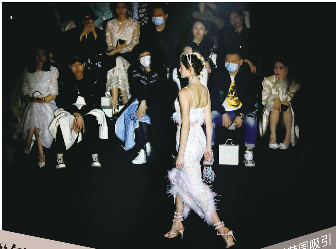
■ 中外模特在著名法国高级时装品牌新品发布会上走秀