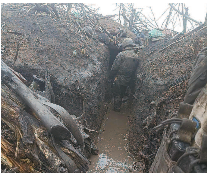
■ 巴赫穆特堑壕内的乌克兰士兵