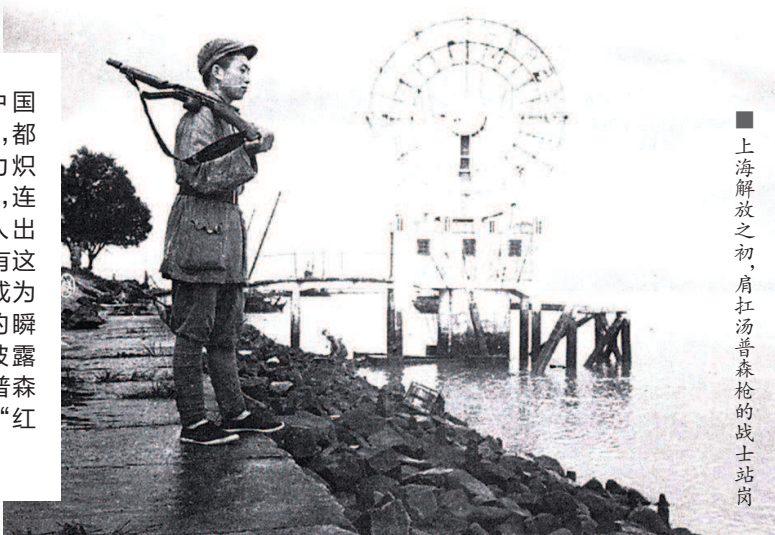
■ 上海解放之初，肩扛汤普森枪的战士站岗

许多反映中国革命的影视剧里，都会出现一款火力炽烈的外国冲锋枪，连一些有历史名人出镜的相片里，都有这把名枪“同框”，成为人们难以忘记的瞬间。本文所要披露的，正是美国汤普森冲锋枪在中国的“红色之旅”。