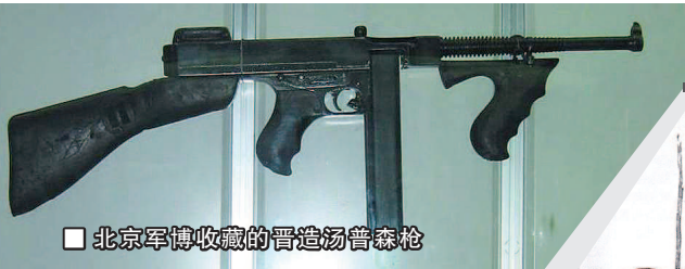
■ 北京军博收藏的晋造汤普森枪

再看海外，汤普森M1921冲锋枪1922年来到中国，主持广东革命政府的孙中山为其卫队装备30支，彼时的中国军人不知打字机为何物，倒是毛驴比较熟悉，考虑到压满子弹的汤普森枪很重，因此一个具有中国特色的绰号诞生了——“压死驴”。别看汤普森枪很重也很贵，但事实证明买得对。1922年6月16日，军阀陈炯明发动广州兵变，以4000余人围攻孙中山官邸，叶挺为首的卫队手持汤普森枪，掩护领袖转移到军舰上。而在标志着国共第一次合作的1924年国民党一大会议期间，后人也能从照片上看到卫兵肩扛汤普森枪，护送孙中山离开会场。1927年，中国共产党在南昌打响武装起义的第一枪，今天南昌八一广场浮雕群中也有汤普森枪的身影，而2017年上映的电影《八月一日》中，就有起义军手持汤普森枪冲锋的镜头，这显然是向历史致敬。但要强调的是，当年汤普森枪只有M1921型出口，相比之后问世的改进型，它在外观上的最大特征是前枪管下有类似手枪柄的握把，而电影中的汤普森枪却采用长条形前护木，这其实是1928年后才有的设计，这种“穿越”是跟现实不符的。