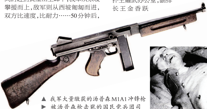
▲ 我军大量缴获的汤普森M1A1冲锋枪 ▶ 被汤普森枪击毙的国民党兵团司令邱清泉