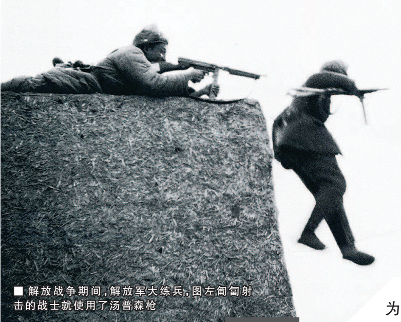
■ 解放战争期间，解放军大练兵，图左匍匐射击的战士就使用了汤普森枪

许多反映中国革命的影视剧里，都会出现一款火力炽烈的外国冲锋枪，连一些有历史名人出镜的相片里，都有这把名枪“同框”，成为人们难以忘记的瞬间。本文所要披露的，正是美国汤普森冲锋枪在中国的“红色之旅”。