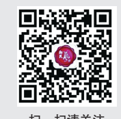
扫一扫请关注“新民艺评”