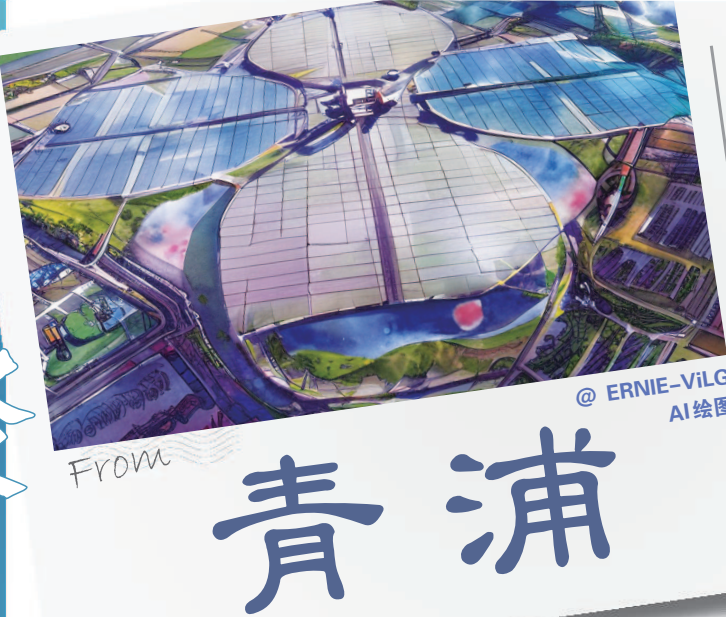
@ ERNIE-VILG AI绘图