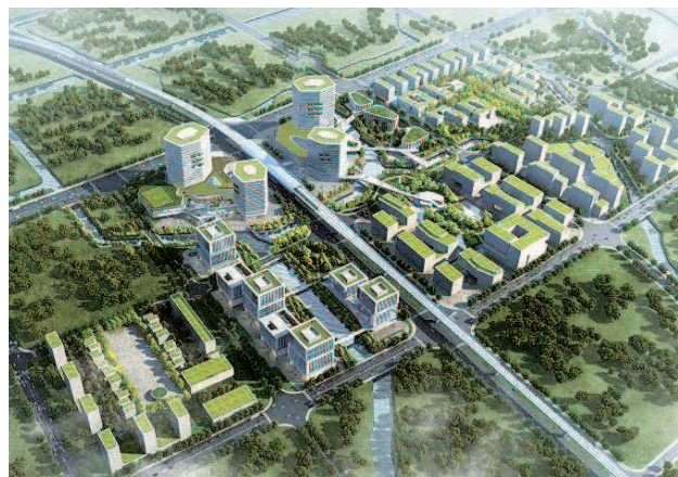
市西软件信息园效果图