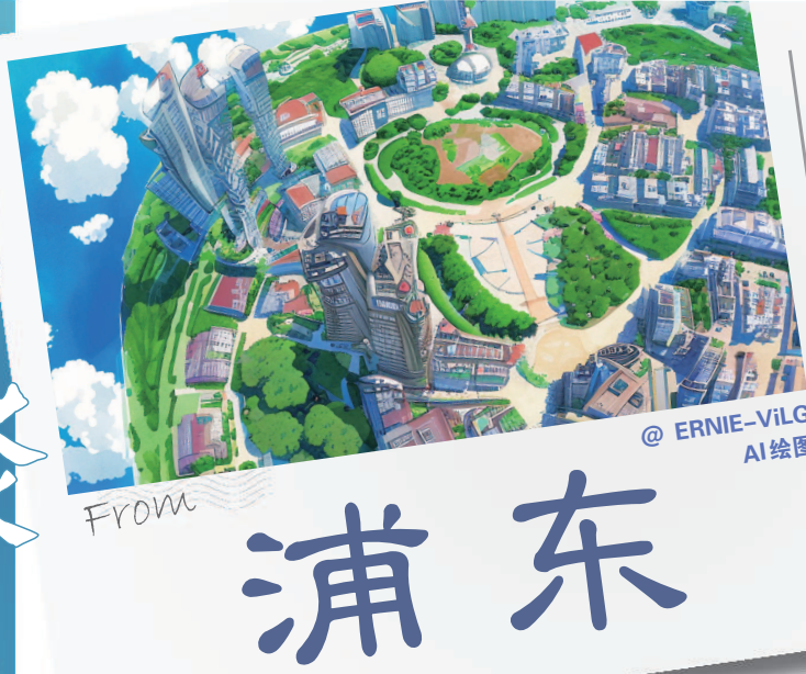
@ ERNIE-VILG AI绘图