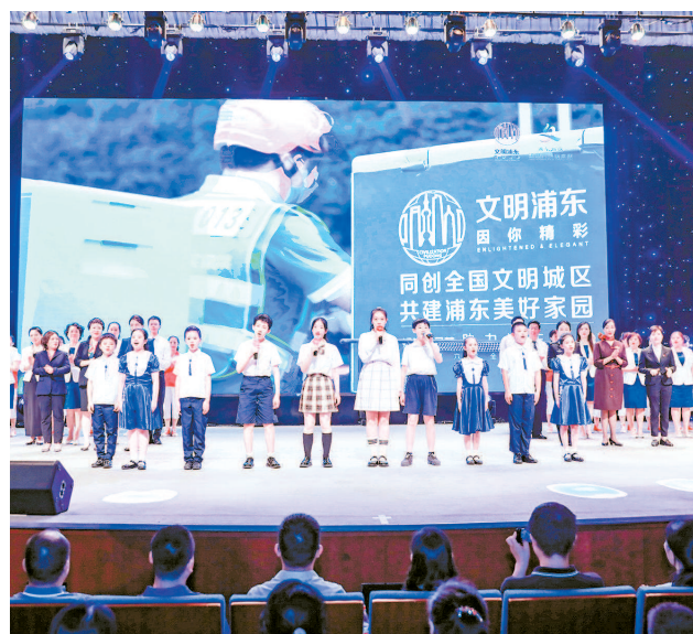
「和颂百年 筑梦未来」浦东新区全民诵读主题活动