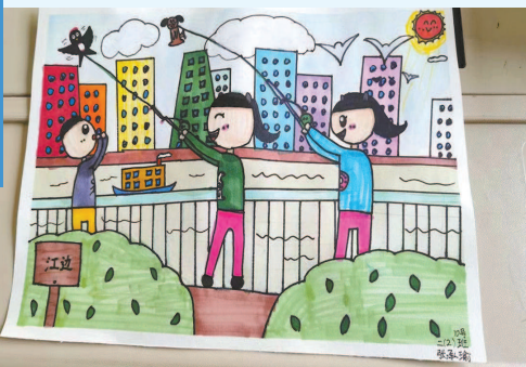
宝山区第二中心小学二(2)班的孩子们描绘心中的游园图