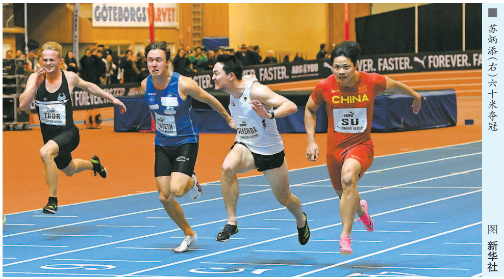
■ 苏炳添(右)六十米夺冠