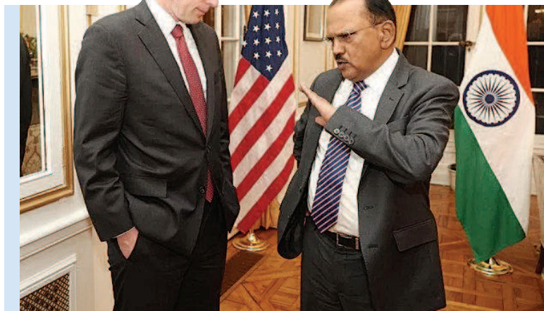
▲美国国家安全顾问沙利文(左)与印度国家安全顾问阿吉特·多瓦尔