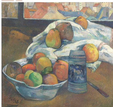
保罗·高更《窗前果盘和啤酒杯》

本报讯(记者 乐梦融)上海博物馆的“从波提切利到梵高:英国国家美术馆珍藏展”明天开幕。记者获悉,上博已经在上周完成布展,精美的文创衍生品和官方配套图册在一楼大厅售卖。展览共展出52件/组油画,观众可一览浓缩的400年欧洲美术史。