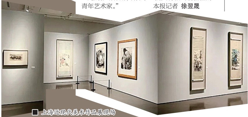
上海近现代美术作品展现场

主办方表示,这一系列活动以充满回忆与烟火气的海派弄堂为载体,绽放海派春节的新旧共鸣、中西互融、情意暖心,希望能让大家感受年味,让好运、健康、财福、良缘等祝福扑面而来。 本报记者 乐梦融