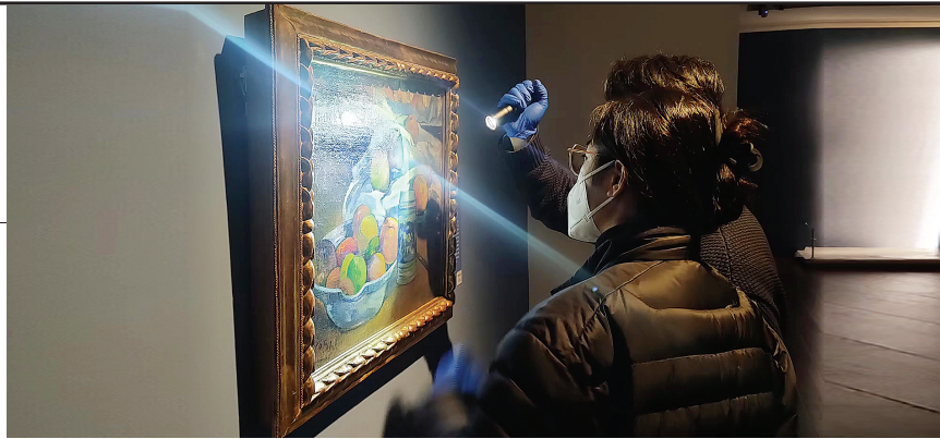
上海博物馆中方策展团队点校高更作品