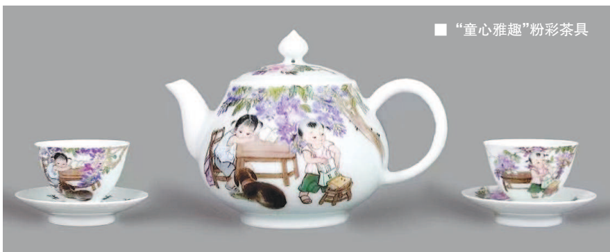
■ “童心雅趣”粉彩茶具

的独特语汇,用细腻线条的勾勒和淡雅别致的敷彩,把乡愁融入童趣,把学习置于天地,乡村郊野景致的清新宁静,与稚童眉宇举止间的天真灵动,仿佛定格于无忧无虑的童年生活和自由快乐的成长岁月。透过画面的渲染,我们似