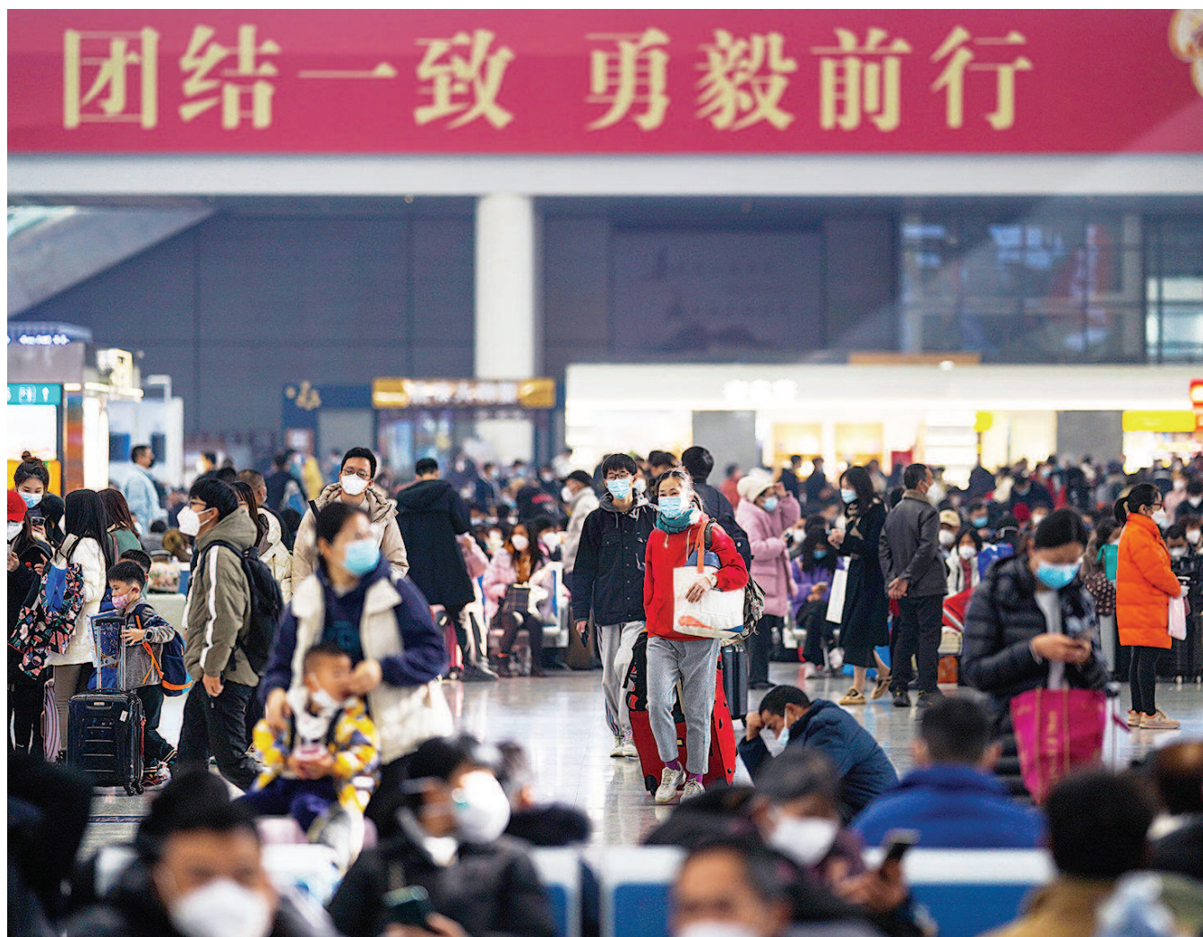
■ 今天是2023年春运首日,上海虹桥站今天预计发送旅客13.5万人,全站预计发送旅客23万人,同比增长45.8%