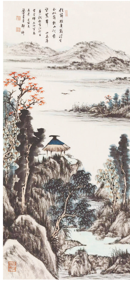
钱考功诗意图四条屏·之三 (中国画) 邵琦

这样一讲,便“找不着北”,也有了“你找不到自己的位置”的意思了,旁人或嘲笑我我:三耳秀才,你找不着北了吧?!