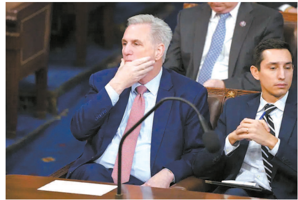
▲表情惆怅的共和党领袖凯文·麦卡锡(左) ◀在美国华盛顿国会,新当选众议员的宣誓大厅空空如也,由于众议院议长人选未定,宣誓仪式被一再推迟

然而,当天的投票结果无情地揭示了特朗普在共和党内影响力下跌的态势。虽然特朗普曾在2022年中期选举前就开始为麦卡锡背书,但众议院内共和党强硬派显然无意理会