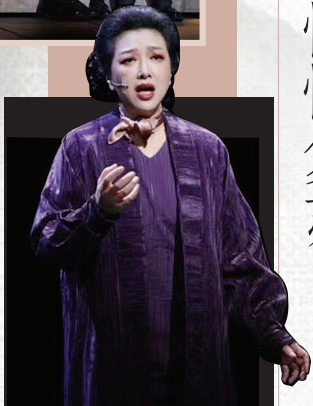
江珊加盟《夜半歌声》剧组