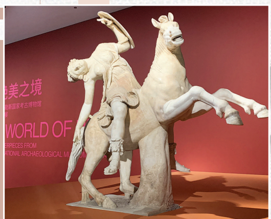
▲“绝美之境”正在浦东美术馆开展

与不歇息的剧场相似，美术馆、博物馆、图书馆等公共文化场所也能开尽开。正在浦东美术馆里举行的“绝美之境”那不勒斯国家考古博物馆珍藏展将开展到2023年4月9日，这是一场对两千年前古罗马文明的盛大展示，耳熟能详的一尊尊古希腊、古罗马大神，让人一睹为快。同样璀璨于世界文明的中华传统文化，也会在上海博物馆闪耀。“何以中国”第二展“长江下游早期文明大展”将成为重头戏，也是明年10月暂因修缮而闭馆的人民广场馆舍的最后一个大展。此前，1月17日至5月7日“从波提切利到梵高：英国国家美术馆珍藏展”也将成为上博“对话世界”文物艺术系列大展的第二个展览，也是中国大陆有史以来阵容最强的欧洲美术史展览。万众期待的上博东馆将于年内开馆。开馆三四个月的上图东馆，俨然已是网红打卡地，将于1月18日起举行“兔——生肖艺术大展”，由市美术家协会与市动漫行业协会携手组稿，邀约来各种动漫卡通、潮流艺术、跨界破圈、各种材质的活蹦乱跳的兔子主题艺术品……遍布在上图东馆的展厅、走廊、休息区等各条动线之中。