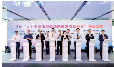
创建人力资源服务驱动未来发展新平台