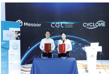
CGL与麦穗智能在进博会上合作签约

以及投融资服务的全方位人才供应链服务,专注于医药健康、互联网、新消费零售、金融、前沿科技、智能制造、芯片半导体、汽车等多个领域。