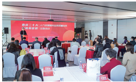
举办人力资源业高质量发展主题活动

主办了全国薪税师职业技能竞赛暨上海市人力资源服务行业薪税师职业技能大赛发布会,推出一批由园区企业开发的“薪税师”、“社群管理师”、“人才测评师”等新职业。持续开展“标准化助推人力资源服务业高质量发展”系列活动,线上参与培训700多人次。举办中国上海人力资源服务产业园区首期人力资源服务机构高级经营和管理人才研修班,加强人力资源服务从业人员专业知识更新。