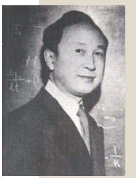
▲ 青年时期的钱学森

他时常以亲笔写信的方式,与党和国家、军队的领导人,以及各个领域的专家、学者探讨各种重大现实问题,表达自己的有关建议、解决方案和一些前瞻性的战略思考。日积月累,他在系统科学、思维科学、地理科学、军事科学、建筑科学、行为科学、金融经济学、大农业以及大成智慧学等哲学和科学技术领域,都提出了不少创新的见解,提炼并深化了现代科学技术理论。他思如泉涌,书信万千、直言尽意,时常有智慧的火花闪现,令我美不胜收,对于他的科学思想和哲学探索也渐渐入了点门。