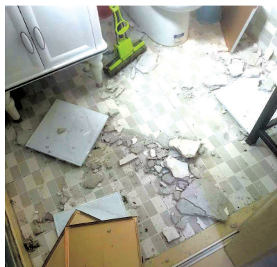
■ 陈阿姨家卫生间一片狼藉