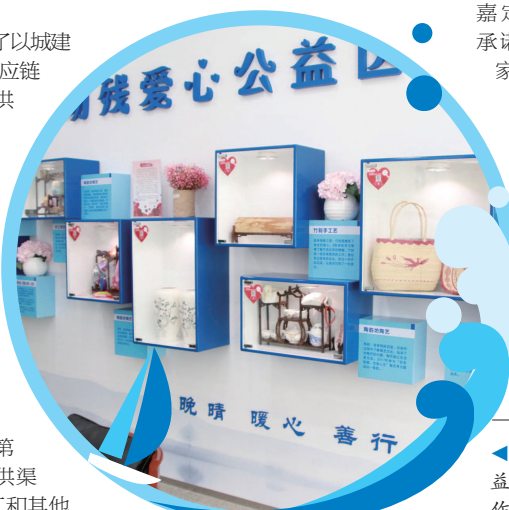
▲建行上海嘉定支行助残爱心公益角中展示着各残障学员手工制作的作品。

时代是出卷人,我们是答卷人。在新的征程上,建行上海分行将继续秉持初心与使命,打造全国文明单位这个向社会展示的靓丽名片,不断自我革新、自我创新,串联起文明与发展,辉映着责任与担当,展现温暖而热忱的时代文明价值。