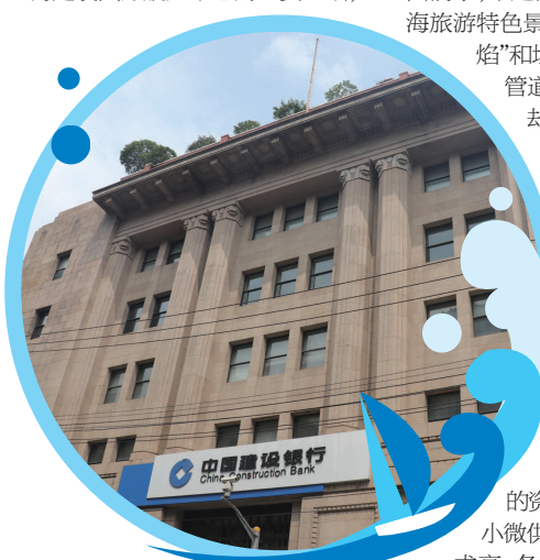
▲坐落在上海外滩边上的建行上海第五支行,独特的艺术建筑风格已经成为它的一张靓丽名片。

你有困难,我来共担。第五支行借助百联集团的保供渠道为建行上海分行辖内员工和其他客户解决物资难题:通过五支行的穿针引线,上海市分行工会通过百联集团下属联华商超,为浦西、浦东值守员工解决保障物资,为行内员工解决用药需求,有效保障了疫情期间金融服务的正常运行,切实将为人民服务做到了实处,将政治担当转化为服务金融实践的激情。