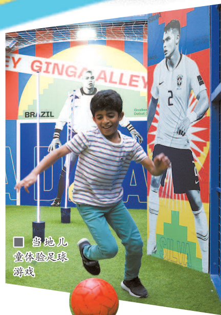
当地儿童体验足球游戏

在卡塔尔世界杯受到许多赞美之际,有个疑问萦绕在一些观众心头:卡塔尔人到底喜不喜欢足球?特别是看到东道主比赛中,不少当地人提前离场。卡塔尔人与足球的关系,有没有像当地的气候,那般火热?