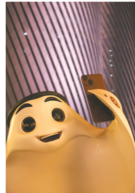
▲ 本届世界杯吉祥物拉伊卜 ▼ 卢塞尔新城高楼林立