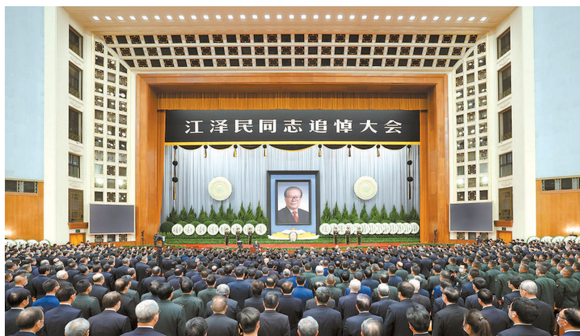
十二月六日,中共中央、全国人大常委会、国务院、全国政协、中央军委在北京人民大会堂隆重举行江泽民同志追悼大会。新华社发