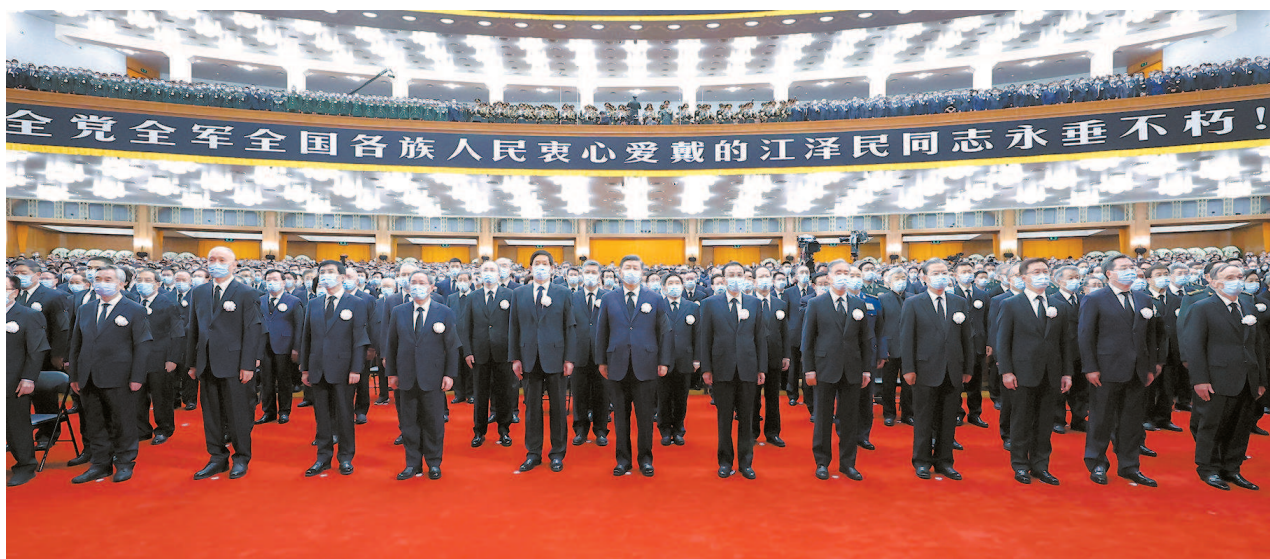
十二月六日,中共中央、全国人大常委会、国务院、全国政协、中央军委在北京人民大会堂隆重举行江泽民同志追悼大会。习近平、李克强、栗战书、汪洋、李强、赵乐际、王沪宁、韩正、蔡奇、丁薛祥、李希、王岐山等参加大会。