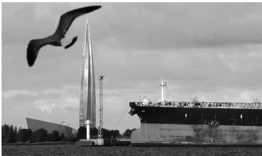
一艘油轮停靠在俄罗斯圣彼得堡港口

希腊、塞浦路斯、马耳他等欧洲航运国家担心限价会对本国庞大的航运业造成打击,波兰、立陶宛、爱沙尼亚等国认为应该把价格上限压得更低才会对俄形成打击,高度依赖俄能源的匈牙利则称此举可能进一步抬高欧洲能源价格。