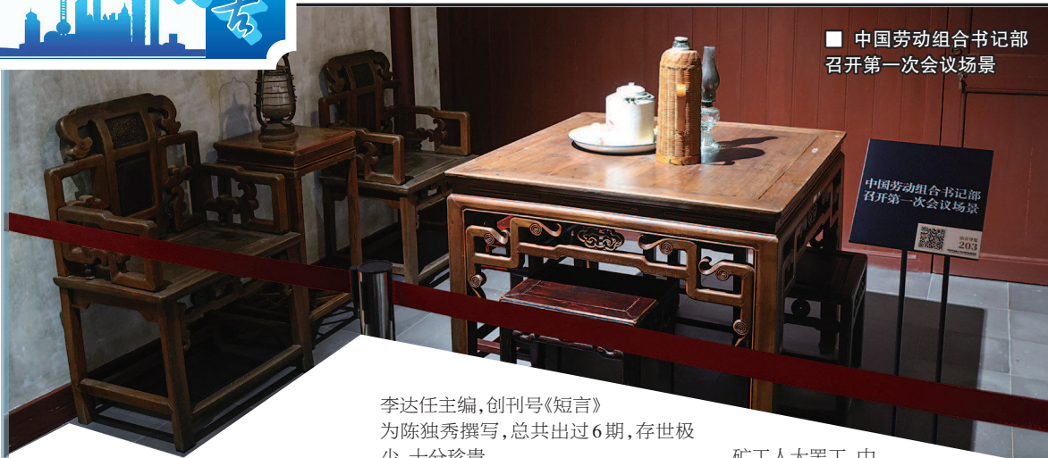
中国劳动组合书记部召开第一次会议场景