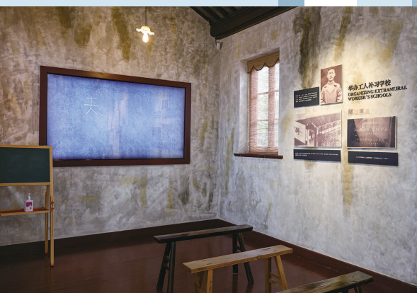
举办工人补习学校