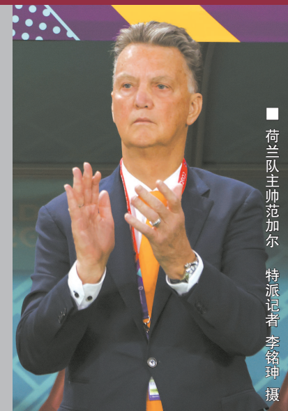
荷兰队主帅范加尔